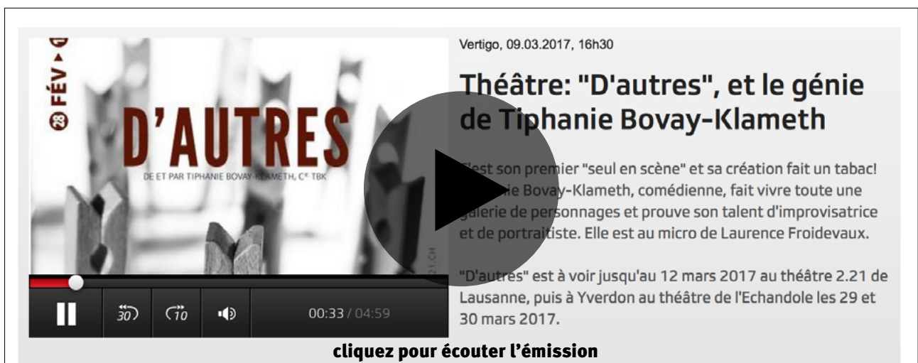
Vertigo, RTS, 09 mars 2017