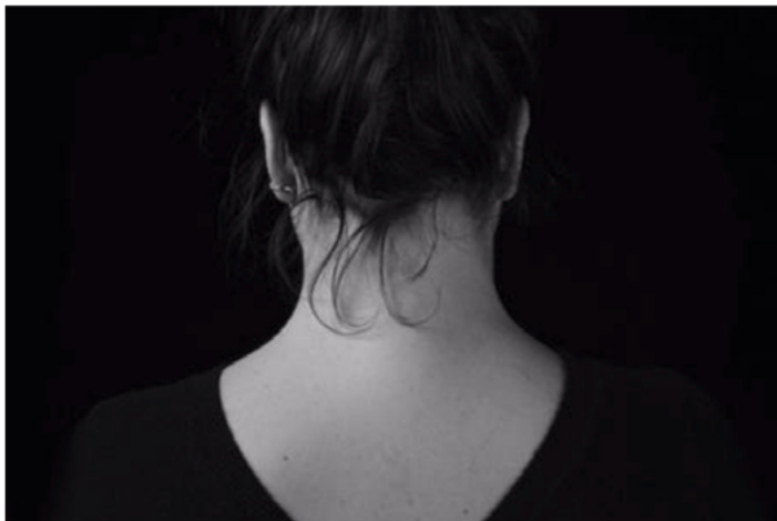
L'affiche du spectacle.

Théâtre La comédienne lausannoise réussit avec son premier solo, D'autres, une performance ethnographique troublante autant qu'hilarante. Critique.