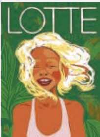
Lotte: fille pirate, Sandrine Bonini, Audrey Spiry, Paris, Sarbacane, 2014, dès 7 ans.

Lotte, c'est cette fille aux cheveux dorés, au sourire éclatant et à l'air rebelle qu'on découvre sur la couverture. Intrépide et débordante de vitalité, elle vit dans une ferme en pleine savane africaine, entourée d'animaux sauvages comme Horace l'éléphant et Achille le lion. Avec son fidèle toucan Igor, elle explore la jungle luxuriant-