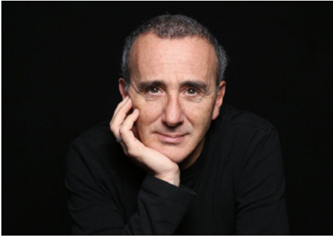
Elie Semoun dans le rôle d'Antoine